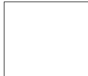
ກາສີ່ລ່ຽມ