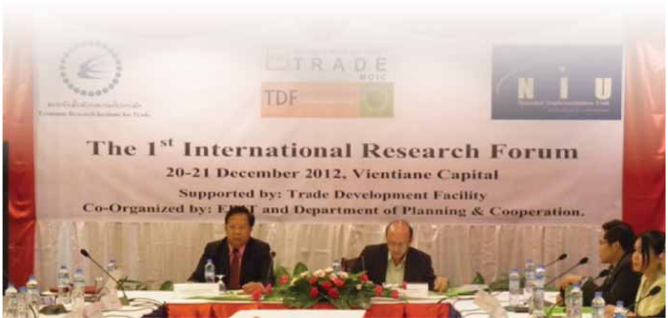
ສຳລັບບົດຄົ້ນຄ້ວາລະອຽດນັ້ນ ແມ່ນສາມາດຕິດຕໍ່ພົວພັນເອົາກັບຄະນະຈັດຕັ້ງກອງປະຊຸມໄດ້ທີ່ ສະຖາບັນຄົ້ນຄວາເສດຖະກິດການຄ້າ, ກະຊວງອຸດສາຫະກຳ ແລະ ການຄ້າ