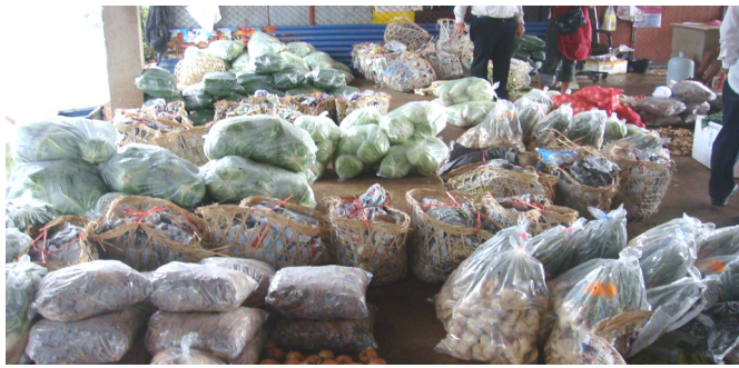
ສິນຄ້າກະສິກຳລາວທີ່ຕະຫຼາດຂາຍສົ່ງໃນຈັງຫວັດອຸບົນ, ປະເທດໄທ