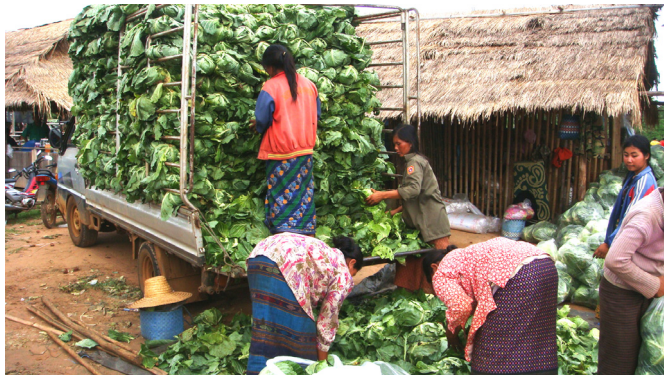
ການສົ່ງອອກຜັກກະລຳຂອງແຂວງຈຳປາສັກໄປປະເທດເພື່ອນບ້ານ

ການສ້າງສູນຝຶກອົບຮົມດ້ານຕັດຫຍິບ: ສະມາຄົມຕັດຫຍິບ (ALGI) ຈະໄດ້ຮັບການຊ່ວຍເຫຼືອໃນການກະກຽມສຳລັບສູນຝຶກອົບຮົມໂດຍມີງົບປະມານ 275.800 ໂດລາສະຫະລັດສຳລັບປີທີ 1 ແລະ 2. ເປົ້າໝາຍຫຼັກຂອງສູນຝຶກອົບຮົມແມ່ນແນໃສ່ການໃຫ້ຄຳປຶກສາ ແລະ ຝຶກອົບຮົມຄູຝຶກຈຳນວນ 3000 ຄົນຢູ່ໃນຂະແໜງອຸດສາຫະກຳຕັດຫຍິບ. ສູນຝຶກອົບຮົມດັ່ງກ່າວຈະໄດ້ຮັບການບໍລິຫານໂດຍຊ່ວງຊານຕ່າງປະເທດໃນໄລຍະ 2 ປີທຳອິດ ແລະ ຄາດວ່າຈະສາມາດດຳເນີນການດ້ວຍຕົນເອງໃນປີທີ 3 ຂອງການຈັດຕັ້ງປະຕິບັດໂຄງການ. ໃນອະນາຄົດ,