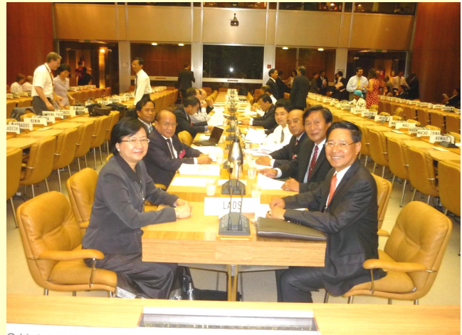
The Fifth Working Party 14 July 2009 in Geneva, Switzerland

The above mentioned documents are the outcome of the negotiations between acceding country and existing WTO members, and then must be approved by WTO General Council or the WTO Ministerial Meeting. After the approval, the acceding member can at any time sign the protocol of accession to accept the conditions, and it shall be ratified by the National Assembly of the acceding country within three months. Membership becomes formally effective 30 days from the day that government informs the WTO of ratification of the protocol of accession by the National Assembly.