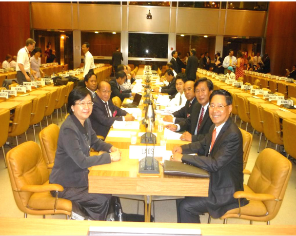
ກອງປະຊຸມໜ່ວຍປະຕິບັດງານຄັ້ງທີ 5 ວັນທີ 14 ກໍລະກົດ 2009 ທີ່ ເຈນນີວາ, ສະວິດເຊີແລນ

ການເຈລະຈາເຂົ້າເປັນສະມາຊິກ WTO ຂອງ ສປປ ລາວ ໄດ້ດຳເນີນມາແຕ່ປີ 1997 ຈົນເຖິງປະຈຸບັນ ໄດ້ຈັດກອງປະຊຸມໜ່ວຍປະຕິບັດງານມາແລ້ວ 5 ຄັ້ງ ແລະ ກຳລັງກະກຽມຈັດຄັ້ງທີ 6 ທີ່ຈະມີຂຶ້ນພາຍໃນຕົ້ນປີ 2010, ໂດຍຈະໄດ້ສົ່ງແຜນປະຕິບັດງານນິຕິກຳສະບັບລວມ (Legislative Action Plan) ພ້ອມທັງ ດ້ານພາສີ (Customs Valuation), ດ້ານສຸຂະພາບໄມ ແລະ ອະນາໄມພືດ (Sanitary and Phytosanitary: SPS), ດ້ານເຕັກນິກທີ່ເປັນອຸປະສັກຕໍ່ການຄ້າ (Technical Barriers to Trade: TBT) ແລະ