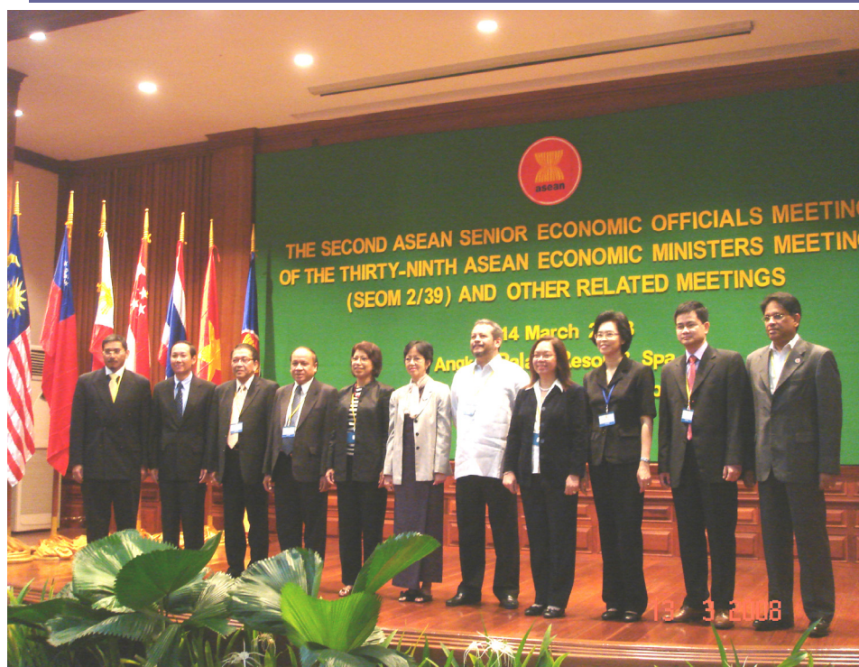
The Second ASEAN Senior Economic Officials Meeting (SEOM 2/39) 10–14 March 2008

• The Common Effective Preferential Tariff Scheme for the ASEAN Free Trade Area (CEPT-AFTA) is a cooperative arrangement among ASEAN Member States which focuses on reducing and eliminating intra-regional tariffs. ASEAN has more recently enhanced the CEPT to a more comprehensive agreement called the ASEAN Trade in Goods Agreement (ATIGA). The ATIGA covers all important areas such as: tariff liberalization, non-tariff barrier liberalization, sanitary and phyto-sanitary measures, customs and trade facilitation. The main rationale for the enhancement of the agreement is due to the fact that ASEAN has concluded negotiations with dialogue partners which resulted in agreements where trade is more liberalized than under the CEPT-AFTA. Another reason is the hope of improving intra-regional trade among ASEAN countries which currently only reach approximately 25 percent of the total trade.