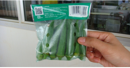
ຜະລິດຕະພັນກະສິກຳ (Okra) ລາວສົ່ງອອກໄປປະເທດ ຍີ່ປຸ່ນ

ສະມາຄົມອຸດສາຫະກຳຕັດຫຍິບລາວຈະເປັນຜູ້ບໍລິຫານສູນຝຶກອົບຮົມໂດຍມີບັນດາອຸດສາຫະກຳຕັດຫຍິບເປັນຜູ້ໃຊ້ບໍລິການຂອງສູນຝຶກດັ່ງກ່າວ. ການຜະລິດໄໝ ແລະ ຫັດຖະກຳແບບຍືນຍົງ: ການຜະລິດໄໝແບບຍືນຍົງໄດ້ຖືກອະນຸມັດໂດຍພື້ນຖານໃນກອງປະຊຸມ Steering Committee ຄັ້ງທີ 2. ໂຄງການປະກອບດ້ວຍ 3 ອົງປະກອບຫຼັກຄື: (1). ການຜະລິດໄໝເພື່ອຊຸກຍູ້ໃຫ້ບໍລິສັດຕົວແບບໃນການຂະຫຍາຍກິດຈະກຳການລ້ຽງໄໝເພື່ອເພີ່ມການຜະລິດໄໝລາວ ແລະ ພັດທະນາຄຸນນະພາບໂດຍການເຕົ້າໂຮມເອົາຫຼາຍໆຄອບຄົວເຂົ້າໃນຂະແໜງການນີ້; (2). ຈັດຕັ້ງງານຫັດຖະກຳແຫ່ງຊາດລາວ; (3). ໃຫ້ຄວາມຊ່ວຍເຫຼືອດ້ານການອອກແບບໂດຍການຝຶກອົບຮົມນັກອອກແບບ 20-25 ຄົນເພື່ອໃຫ້ກາຍເປັນນັກອອກແບບທີ່ມີຄຸນນະພາບ. ການພັດທະນາທຸລະກິດກະສິກຳ: ບົດລາຍງານການສຶກສາກ່ຽວກັບທຸລະກິດກະສິກຳແບບຂ້າມແດນໄດ້ມີການສຶກສາໂດຍທີມງານເຊິ່ງປະກອບດ້ວຍສະມາຊິກຈາກກົມສົ່ງເສີມການຜະລິດ ແລະ ການຄ້າ (DPTP-GSEU), NIU ແລະ ຜູ້ຊ່ວງຊານພາຍໃຕ້ການສະໜັບສະໜູນຈາກທະນາຄານໂລກທີ່ແຂວງຈຳປາສັກໃນໄລຍະອາທິດທຳອິດຂອງເດືອນ ມິຖຸນາ 2009. DPTP ໄດ້ຈັດກອງປະຊຸມໃນວັນທີ 23 ກໍລະກົດ 2009 ທີ່ເມືອງປາກເຊເພື່ອສະເໜີບົດລາຍງານການສຶກສາໃນເບື້ອງຕົ້ນ. ຜູ້ຊ່ວງຊານໄດ້ຊີ້ໃຫ້ເຫັນຂໍ້ຈຳກັດຫຼັກ ໃນການພັດທະນາທຸລະກິດກະສິກຳເຊັ່ນ: ຂໍ້ຈຳກັດທາງດ້ານການຜະລິດ, ຂໍ້ຈຳກັດທາງດ້ານທຸລະກິດ ແລະ ຂໍ້ຈຳກັດທາງດ້ານການຄ້າ. ນອກນີ້, ຄວາມພະຍາຍາມຂອງເຈົ້າໜ້າທີ່ແຂວງຈຳປາສັກໃນການອໍານວຍຄວາມສະດວກໃນການລົງທຶນຂ້າມແດນ ໃນຂະແໜງທຸລະກິດກະສິກຳ