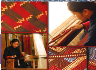
ຄະນະຈັດພິມ