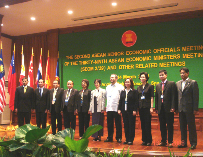
ກອງປະຊຸມເຈົ້າໜ້າທີ່ອາດູໂສເສດຖະກິດອາຊຽນ ຄັ້ງທີ 2/39 ໃນລະຫວ່າງວັນທີ 10 -14 ມີນາ 2008, ທີ່ ສຽມລຽບ ປະເທດ ກຳປູເຈຍ