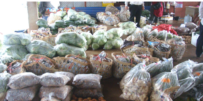
Lao Agriculture products to be exported to Ubonratchatani Province, Thailand (2009)

The scoping study on cross-border agribusiness was carried out by a joint team including members of the DPTIP GSEU, NIU and a specialist supported by the World Bank in Champasack province during the first week of June 2009. DPTIP organized a workshop on July 23, 2009 in Pakse to present the study's initial findings. The specialist pointed out three key constraints to agribusiness development such as production constraints, business constraints and trade constraints. Some key results from efforts by Champasack provincial authorities to facilitate cross-border investment in agribusiness were also pointed out. These include: agribusiness investments, of US$100 million between 2000 and 2008; Provincial Public Private Dialogue (PPPD) has been institutionalized; 3 industrial zones (2.284 ha) designated and the signing of a series of five "contract farming" Memorandums of Understanding with Ubon Ratchathanee Province. A project design for Agro-processing will be drafted based on the results of the workshop in Pakse.