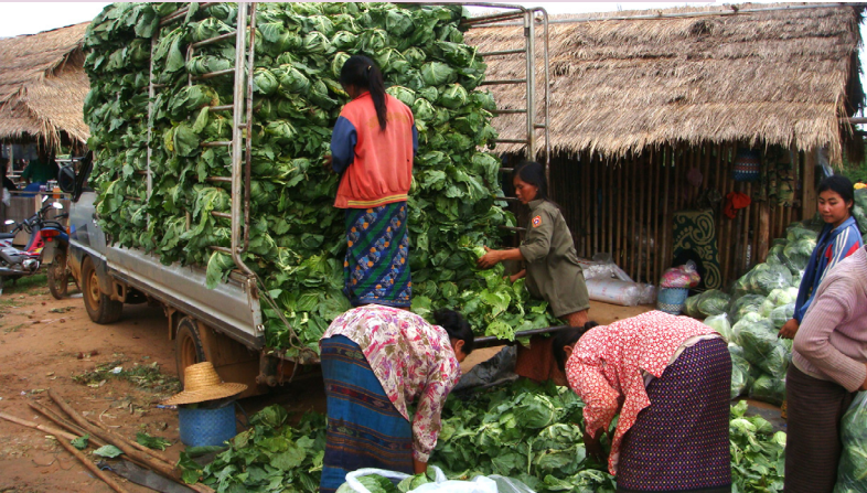
Cabbage to be exported to neighboring countries (2009)