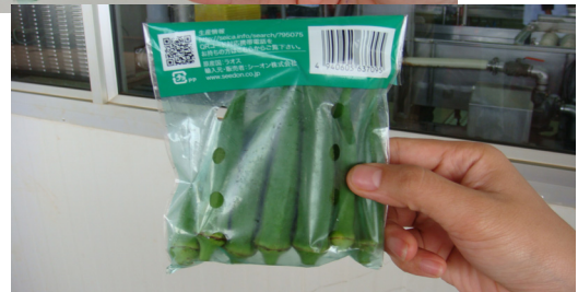
Lao Okra exports to Japan